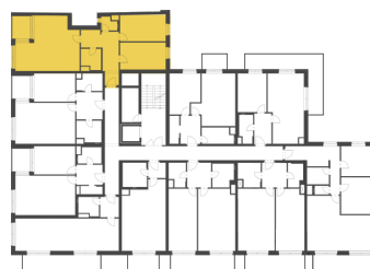
Schéma půdorysu představuje dispoziční řešení bytu. Zobrazené vybavení nábytkem, vestavěné skříně, kuchyňská linka včetně spotřebičů a pračky nejsou součástí dodávky bytu. Toto vybavení je zobrazeno pouze pro názornost. Celková podlahová plocha je vypočtena dle nařízení vlády č. 366/2013 Sb. Veškeré informace jakkoliv publikované v tomto dokumentu jsou nezávazné marketingové informace obecné povahy, které nelze vykládat jako nabídku na uzavření smlouvy ani se jich nelze dovolávat.

+420 226 292 876 info@homeportal.cz www.homeportal.cz