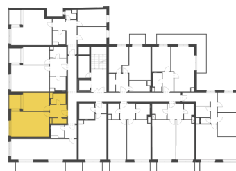
Schéma půdorysu představuje dispoziční řešení bytu. Zobrazené vybavení nábytkem, vestavěné skříně, kuchyňská linka včetně spotřebičů a pračky nejsou součástí dodávky bytu. Toto vybavení je zobrazeno pouze pro názornost. Celková podlahová plocha je vypočtena dle nařízení vlády č. 366/2013 Sb. Veškeré informace jakkoliv publikované v tomto dokumentu jsou nezávazné marketingové informace obecné povahy, které nelze vykládat jako nabídku na uzavření smlouvy ani se jich nelze dovolávat.

+420 226 292 876 info@homeportal.cz www.homeportal.cz