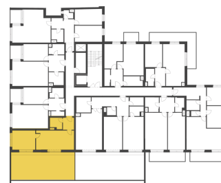
Schéma půdorysu představuje dispoziční řešení bytu. Zobrazené vybavení nábytkem, vestavěné skříně, kuchyňská linka včetně spotřebičů a pračky nejsou součástí dodávky bytu. Toto vybavení je zobrazeno pouze pro názornost. Celková podlahová plocha je vypočtena dle nařízení vlády č. 366/2013 Sb. Veškeré informace jakkoliv publikované v tomto dokumentu jsou nezávazné marketingové informace obecné povahy, které nelze vykládat jako nabídku na uzavření smlouvy ani se jich nelze dovolávat.

+420 226 292 876 info@homeportal.cz www.homeportal.cz